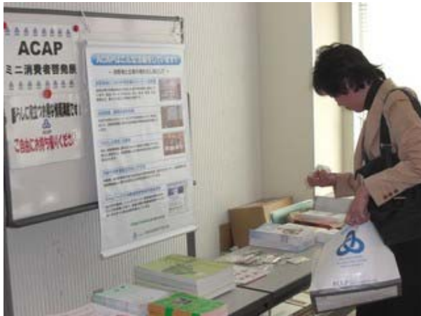
資料の展示・配布とともに、タペストリーを使って ACAPを紹介