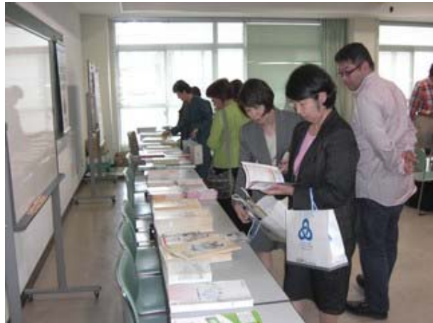
資料の内容をどのように授業などに活かすか、 真剣なまなざしで確認される参加者

10月10日(土)～10月11日(日)、長崎大学文教キャンパス(長崎市)において、「日本消費者教育学会第29回全国大会」が開催された。